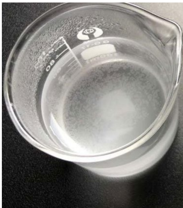
OHNE DEN EVODESCALE