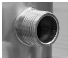
4 mm Wandstärke des Flachgewindes